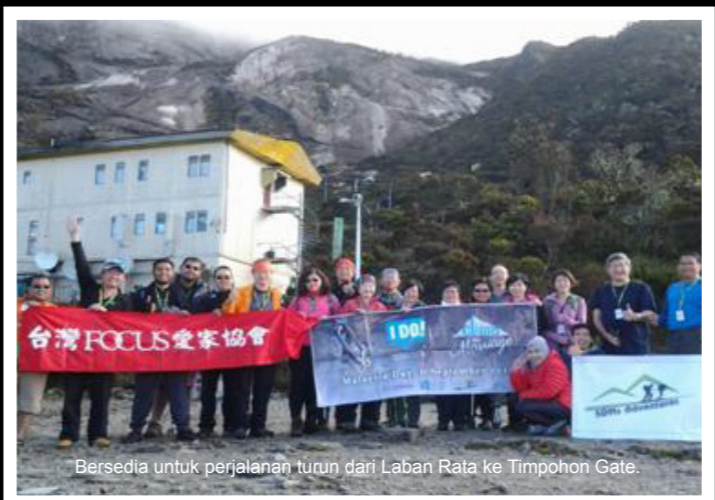
Bersedia untuk perjalanan turun dari Laban Rata ke Timpohon Gate.