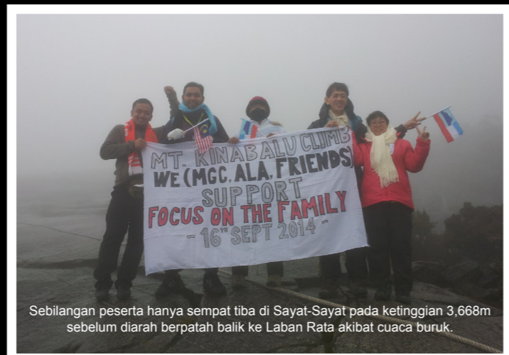
Sebilangan peserta hanya sempat tiba di Sayat-Sayat pada ketinggian 3,668m sebelum diarah berpatah balik ke Laban Rata akibat cuaca buruk.