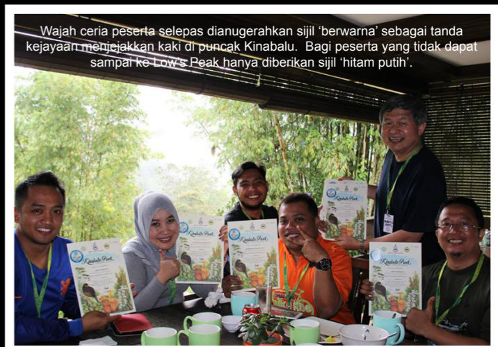
Wajah ceria peserta selepas dianugerahkan sijil 'berwarna' sebagai tanda kejayaan menjejakkan kaki di puncak Kinabalu. Bagi peserta yang tidak dapat sampai ke Low's Peak hanya diberikan sijil 'hitam putih'.